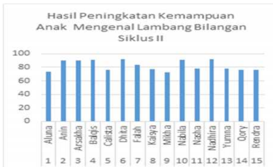
Grafik 3 Hasil Peningkatan Kemampuan Mengenal Lambang Bilangan Siklus II.

Pada tabel di atas dapat diketahui bahwa peningkatan mengenal lambang bilangan semua aspek, yaitu aspek mengenal lambang bilangan, mengurutkan lambang bilangan dan menyebutkan lambang bilangan 1-5. Berdasarkan data serta tabel di atas dapat dijelaskan kemampuan anak dalam mengenal lambang bilangan mengalami peningkatan mencapai hasil persentase 82,59%. Berdasarkan data di atas dapat dideskripsikan pada grafik berikut: