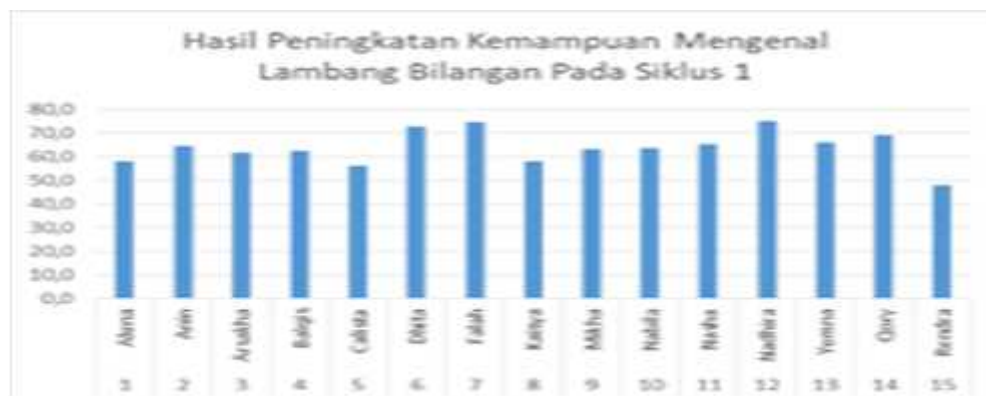
Grafik 2 Hasil Kemampuan Mengenal Lambang Bilangan Siklus I

Berlandaskan data di atas dapat dideskripsikan pada grafik berikut: