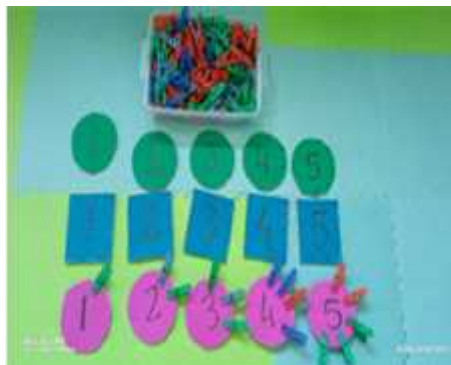
Gambar 2 Anak sedang mengurutkan angka melalui media menjepit angka.

Kegiatan selanjutnya yang dilakukan dalam menjepit angka yaitu anak menjepit angka sesuai dengan urutan yang disebutkan guru melalui media menjepit angka mulai dari angka 1-5. Melalui kegiatan mengurutkan angka 1-5 anak akan memahami urutan lambang bilangan 1-5. Riset ini relevan dengan riset (Nayazik Akhmad et al., 2019) mengatakan bahwa dengan kegiatan bermain mengurutkan kartu angka anak dapat mengenal bentuk-bentuk angka dan mengurutkan lambang bilangan dengan benar.