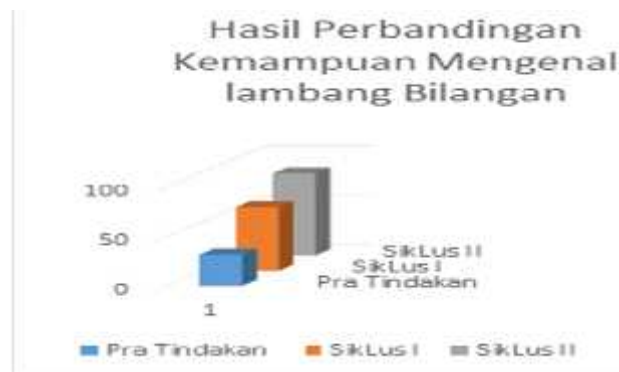
Grafik 4 Hasil Perbandingan Kemampuan Mengenal lambang Bilangan

Grafik di atas memperlihatkan temuan kemampuan anak usia 4-5 tahun di TKIT MTA Karawang dalam kemampuan mengenal lambang bilangan mengalami peningkatan yaitu pada pra tindakan mendapatkan persentase sebesar 31,39%, kemudian diberikan tindakan pada siklus I meningkat menjadi 63,91%. Dilanjutkan pada tindakan siklus II kemampuan anak dalam mengenal lambang bilangan meningkat menjadi 82,59%. Pada hasil akhir ini yaitu 82,59%, telah melampaui kriteria keberhasilan yang di harapkan dengan baik, melalui bermain media menjepit angka.