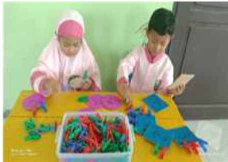
Gambar 3 anak sedang menyebutkan lambang bilangan.

Bermain media menjepit angka akan mempermudah anak mengenal lambang bilangan atau angka yaitu dengan membilang benda, mengurutkan, menghubungkan dan menyebutkan simbol angkanya 1-5. Media menjepit angka merupakan media untuk digunakan dalam mengenalkan aspek kognitif pada anak seperti dapat mengetahui angka atau lambang bilangan, konsep, warna dan bentuk, dan memberikan pembelajaran kepada anak secara langsung. Adapun manfaat yang lainnya dari media menjepit angka adalah untuk melatih motorik halus anak.