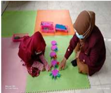
Gambar 1 Anak sedang bermain menggunakan media menjepit angka.

Kegiatan selanjutnya yang dilakukan dalam menjepit angka yaitu anak menjepit angka sesuai dengan urutan yang disebutkan guru melalui media menjepit angka mulai dari angka 1-5. Melalui kegiatan mengurutkan angka 1-5 anak akan memahami urutan lambang bilangan 1-5. Riset ini relevan dengan riset (Nayazik Akhmad et al., 2019) mengatakan bahwa dengan kegiatan bermain mengurutkan kartu angka anak dapat mengenal bentuk-bentuk angka dan mengurutkan lambang bilangan dengan benar.