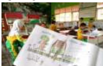
Gambar 6. Gambar bercerita

Kegiatan yang berkaitan dengan nilai kreatif yaitu kegiatan gambar bercerita pada setiap hari Sabtu. Dapat dilihat pada gambar dibawah ini.