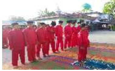
Gambar 3. Shalat berjamaah