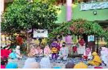
Gambar 2. Imtak