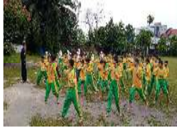
Gambar 7. Silat

hari Sabtu. Dapat dilihat pada gambar dibawah ini.