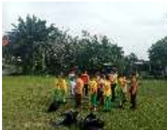
Gambar 8. Futsal

Kegiatan yang berkaitan dengan nilai pantang menyerah yaitu kegiatan futsal dan permainan ular tangga pada setiap hari Sabtu. Dapat dilihat pada gambar dibawah ini.