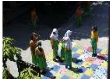
Gambar 9. Permainan Ular tangga