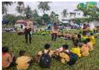
Gambar 4. Pramuka

Kegiatan yang berkaitan dengan nilai tanggungjawab yaitu kegiatan pramuka pada setiap hari Sabtu. Dapat dilihat pada gambar dibawah ini.