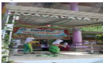
Gambar 5. Menari

Kegiatan yang berkaitan dengan nilai percaya diri yaitu kegiatan menari pada setiap hari Sabtu. Dapat dilihat pada gambar dibawah ini.