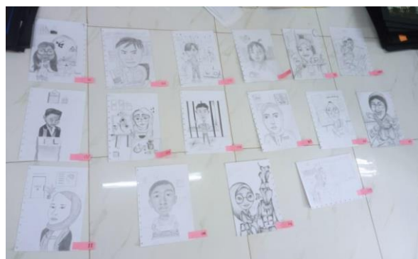
Gambar 9. Proses pemilihan karya terbaik

Setelah peserta menyelesaikan gambarnya, tim PKM memilih enam terbaik, tujuannya agar para peserta lebih termotivasi dalam mengikuti pelatihan. Proses pemilihannya adalah dengan menjajarkan semua hasil karya dan melakukan perbandingan dengan foto diri peserta. Proses Penilaian Karya, pertama pengumpulan karya dari para peserta dan penomoran karya sehingga karya yang tidak bernama untuk menjaga objektivitas.