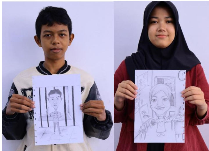
Gambar 8 . Hasil karya peserta

Karya terbaik dari kegiatan menggambar karikatur bertema "Aku Pahlawan Masa Depan" adalah: