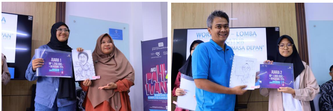
Gambar 10. Penyerahan hadiah dari Kaprodi dan narasumber