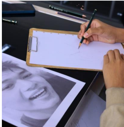
Gambar 4. Proses Membuat karikatur dari pengamatan foto diri peserta.

pengamatan yang intensif dari satu bagan gambar ke bagan gambar yang lainnya dengan observasi yang optimal.