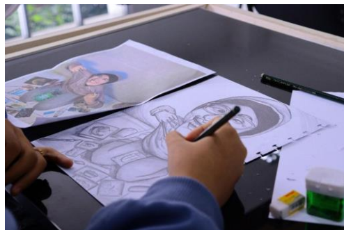
Gambar 7. Proses penggambaran karikatur

Setelah menggambar tracing wajah dan peserta sudah memahami prinsip menggambar realis, peserta diarahkan pada materi yang berhubungan mentransformasikan gambar wajah tersebut ke karikatur. Rata-rata peserta pernah menggambar potret diri, namun belum pernah mencoba menggambar karikatur. Tahapan ini peserta diarahkan untuk berani mentransformasikan gambar diri yang bergaya realis menjadi gaya karikatur, dengan menerapkan ciri-ciri gambar karikatur. Beberapa peserta nampak agak kesulitan, namun tim PKM dan mahasiswa prodi DKV UPM membantu teknis penggambaran, mulai dari menarik garis, mencontohkan gambar karikatur, mengarsir, sampai dengan penggambaran latar belakang.