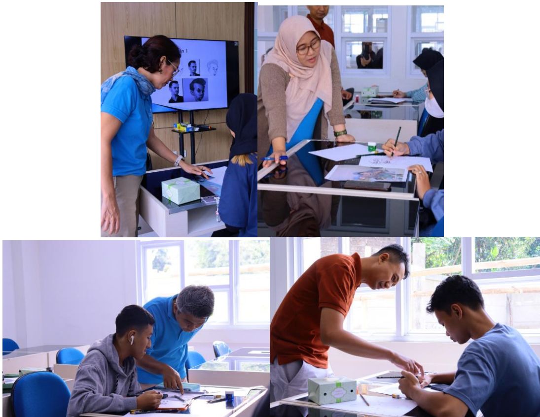
Gambar 5. Arahan tim PKM untuk peserta