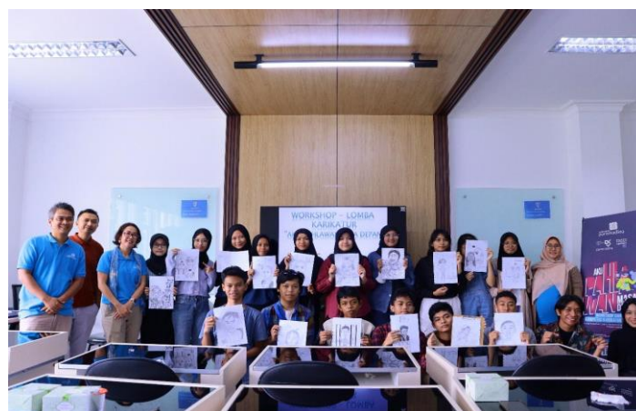
Gambar 10. Para seluruh peserta

Dari hasil wawancara yang dilakukan dapat disimpulkan bahwa lomba karikatur ini sangat membantu bagi siswa yang suka menggambar tetapi belum tau bagaimana membuat gambar karikatur yang benar. Dari materi yang disampaikan peserta dapat memahami dan dapat menggambar karikatur.