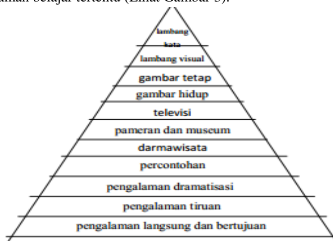
Gambar 3. Kerucut Pengalaman dari Edgar Dale

Pada hakekatnya kegiatan belajar mengajar adalah proses komunikasi, klasifikasi pengalaman menurut tingkat dari yang paling konkret ke yang paling abstrak. Klasifikasi tersebut kemudian dikenal dengan nama kerucut pengalaman ( Cone of Experience ) dari [13] dan pada saat itu dianut secara luas dalam menentukan alat bantu apa yang paling sesuai untuk pengalaman belajar tertentu (Lihat Gambar 3).