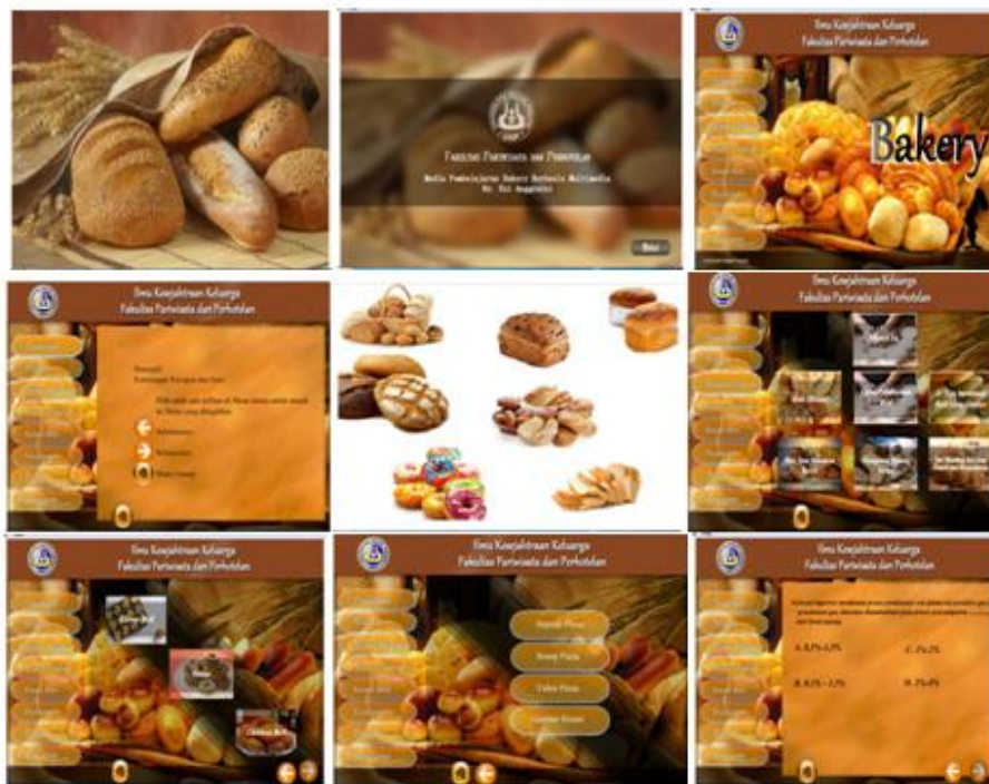
Gambar 2. Tampilan rancangan adobe flash CS6